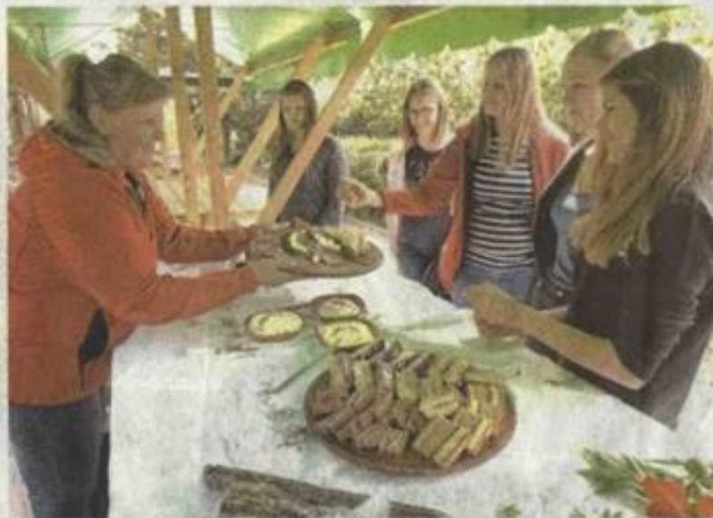
Lokalno pridelana hrana je vredna tudi kakšnega centa več.

Tako so včeraj popoldne na Biotehniški šoli pripravili prireditve z naslovom Nazaj h koreninam - lokalno nad globalno . Govorili so o označevanju ekološko pridelanih živil in ekološkem